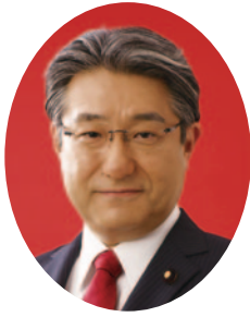
参議院議員 石田昌宏